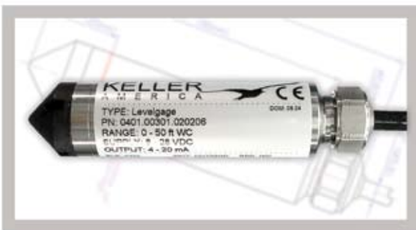
Levelgage / Acculevel

El LevelRat, elaborado con un rango de nivel y longitud de cable personalizados, se embarca típicamente en 3 días o menos, como es el caso de todos nuestros transmisores de presión y nivel manufacturados en los Estados Unidos. Los mismos incluyen nuestros transmisores de nivel sumergibles Levelgage / Acculevel y nuestros transmisores de presión de bombas y de nivel de tanques de almacenaje elevados Valueline / Preciseline. Sin importar cuál sea el requisito de medición de presión o de nivel, puede encontrar la solución en la línea de productos de Keller. Llame sin costo al 877-253-5537 para hablar sobre sus requisitos con uno de nuestros ingenieros de ventas experimentados.