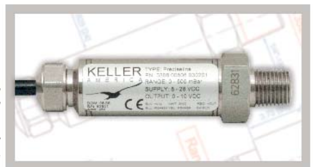
Valueline / Preciseline

Visite www.kelleramerica.com com para que conozca nuestra línea completa de productos.